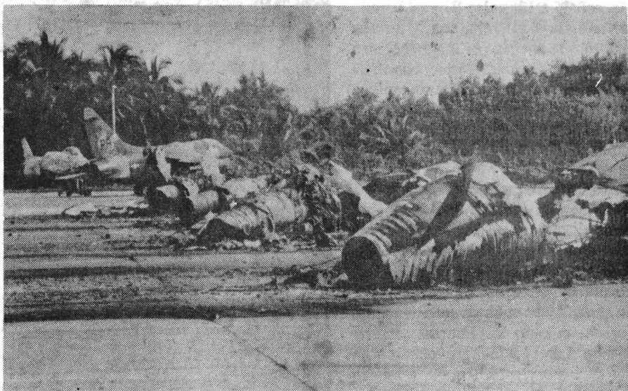
Los Macheteros destruyeron 9 aviones de la Guardia Nacional