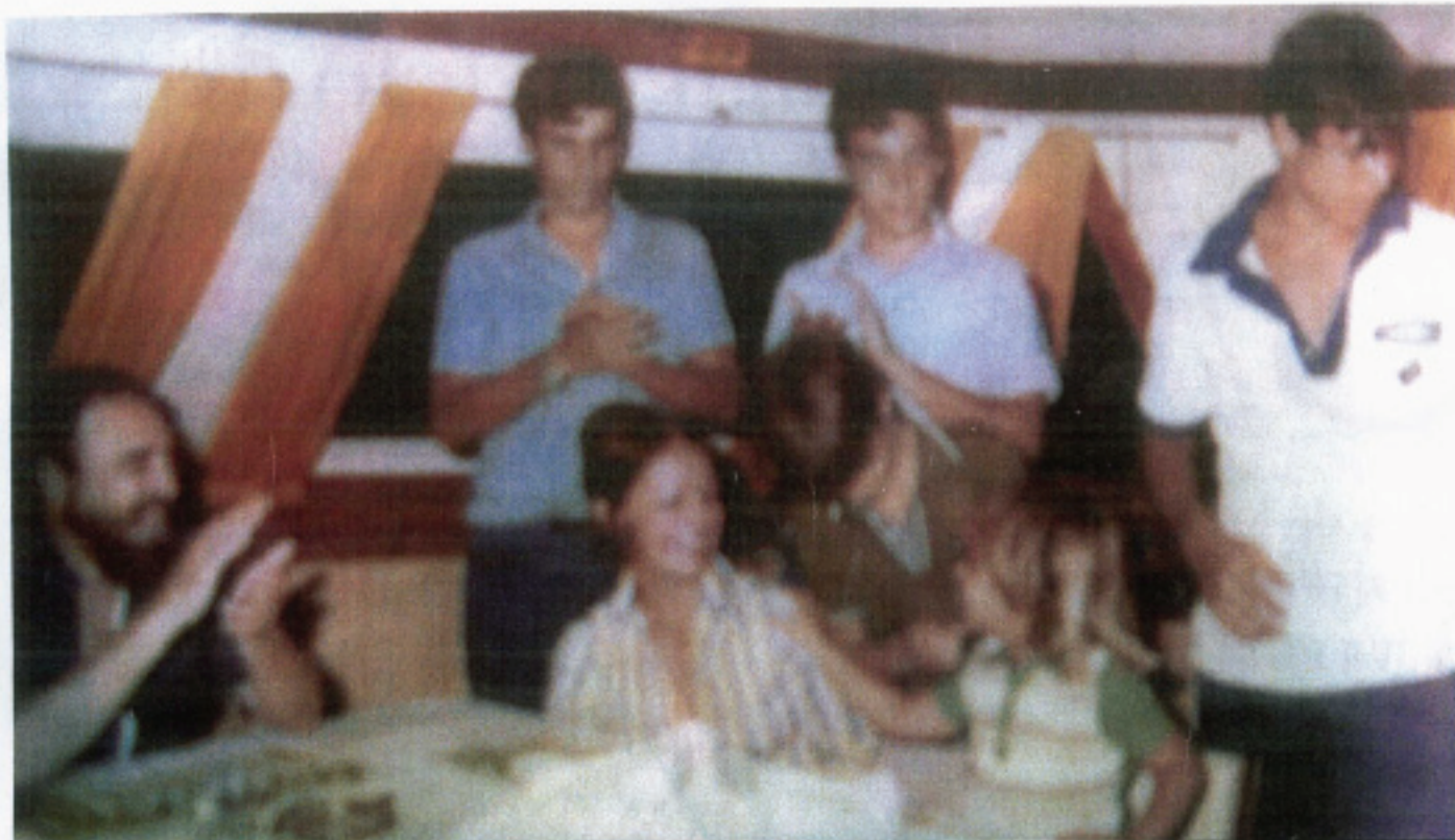
EN EL YATE FAMILIAR. Castro ha reconocido que no dedicó el tiempo suficiente a sus hijos. Sin embargo, en sus cumpleaños procuraba estar algunos minutos con ellos. Aquí con Alexis, Alejandro, Alex, (abajo) Dalia, Antonio y Ángel, quien celebraba sus tres años.