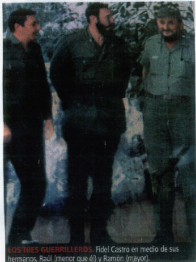
LOS TRES GUERRILLEROS. Fidel Castro en medio de sus hermanos, Raúl (menor que él) y Ramón (mayor).

N o. En Cuba no existe la figura de la familia presidencial. Probablemente sea el único país donde los medios de comunicación nacionales tienen estrictamente prohibido difundir imágenes e información que tengan que ver con la mujer y los descendientes de su primer mandatario.