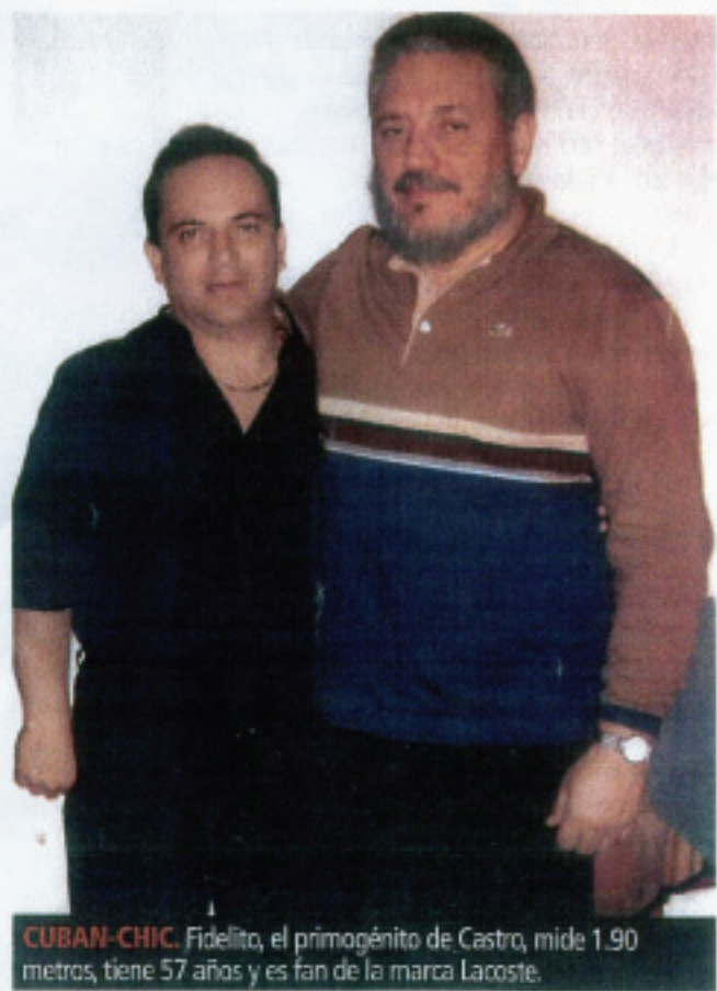
CUBAN-CHIC. Fidelito, el primogénito de Castro, mide 1.90 metros, tiene 57 años y es fan de la marca Lacoste.