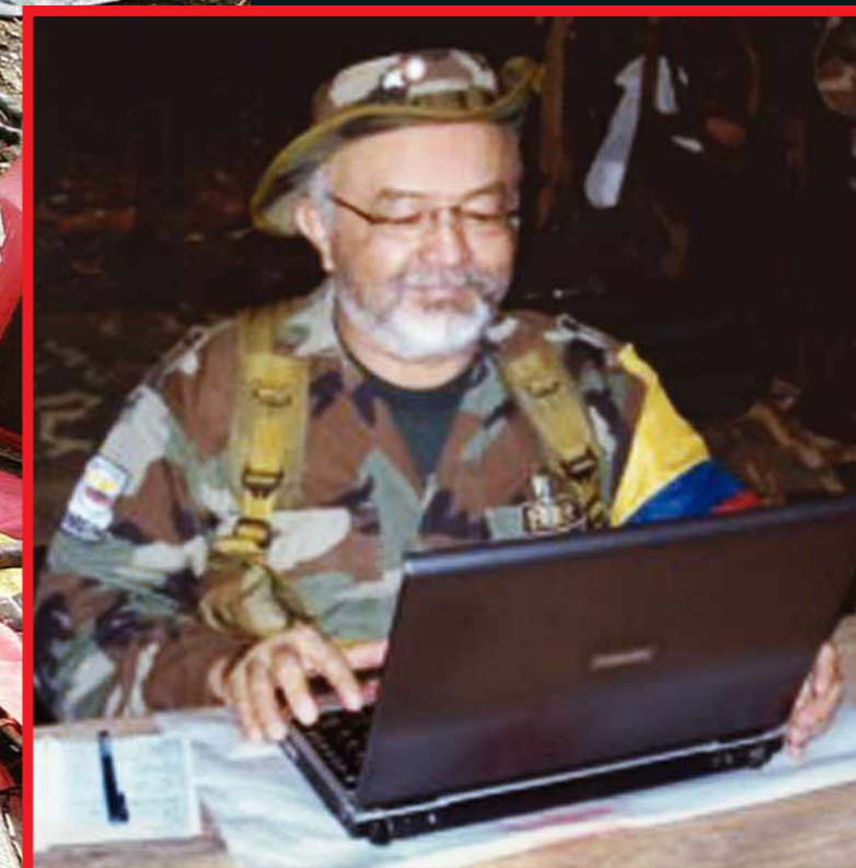
"Raúl Reyes" con su computadora. El contenido revela los nexos de las FARC con Chávez y Correa.