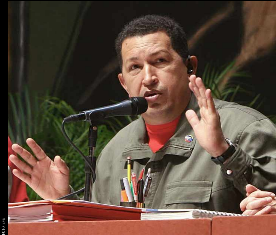
Uribe se mantuvo resuelto. Chávez quedó expuesto, y reaccionó violentamente.