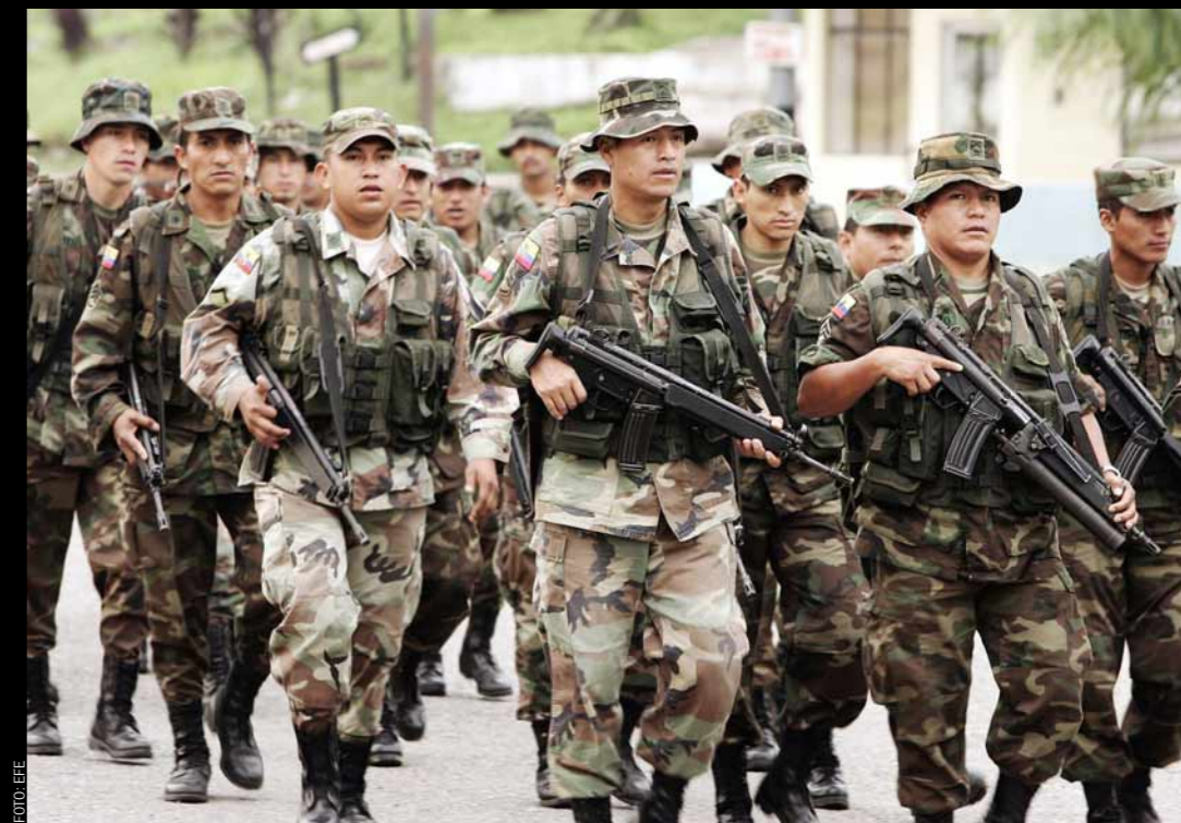
En Venezuela, belicismo de Chávez es criticado por opositores.

UN día antes de que lo cazaran como a un conejo en el remolino del monte, 'Raúl Reyes' redactó un correo electrónico a sus camaradas del Secretariado. Consideraba favorable para la guerrilla la última liberación de secuestrados, pero las declaraciones de Luis Eladio Pérez planteaban nuevos retrocesos. Lejos de ablandarse por ningún grado del Síndrome de Estocolmo, el ex congresista cautivo durante seis años narró con pavoroso detalle las miserias a las que lo sometieron las FARC.