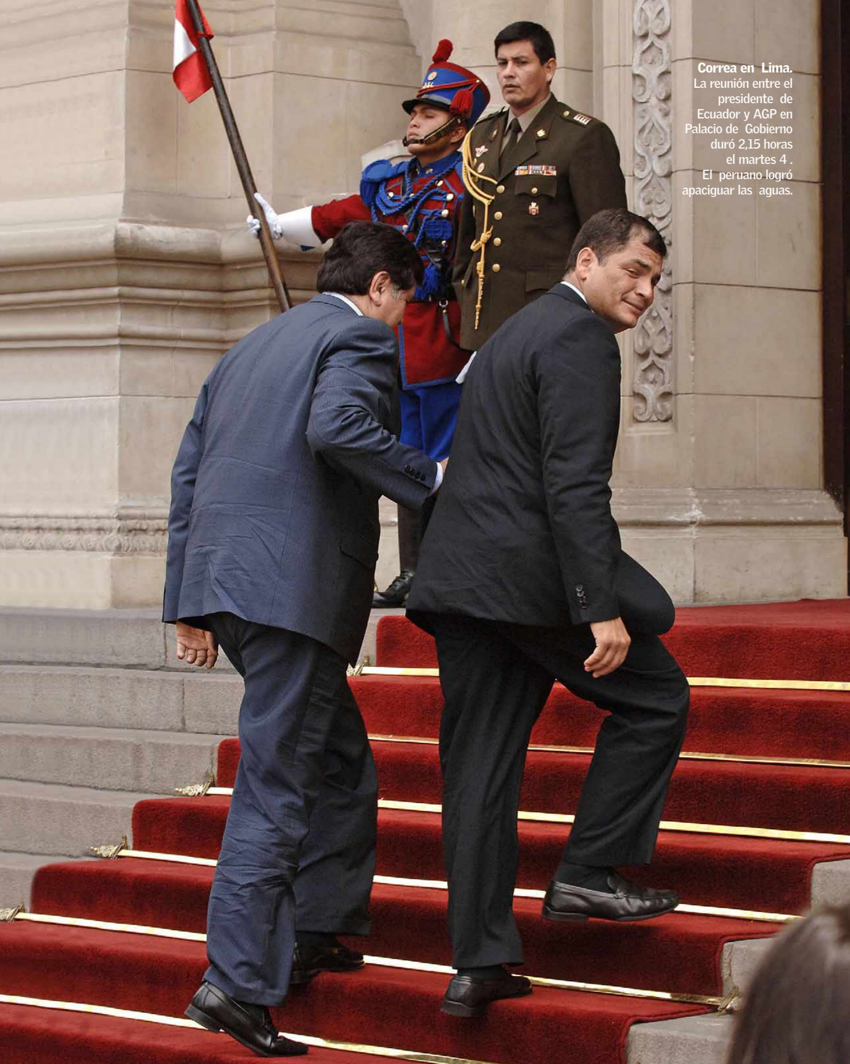
Correa en Lima. La reunión entre el presidente de Ecuador y AGP en Palacio de Gobierno duró 2,15 horas el martes 4. El peruano logró apaciguar las aguas.