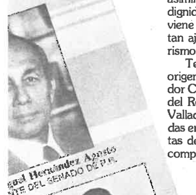
Miguel Hernández Agosto PRESIDENTE DEL SENADO DE P.R.