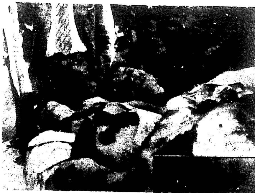
En una foto de la época, los cuerpos de Guiteras y Aponte yacen en el cementerio de Matanzas, acribillados a tiros en una celada de los genizaros de Batista.

al lado del pueblo representado por Guiteras, sino al lado del embajador yanqui Caffery, representante de los intereses que obstaculizan esa felicidad.