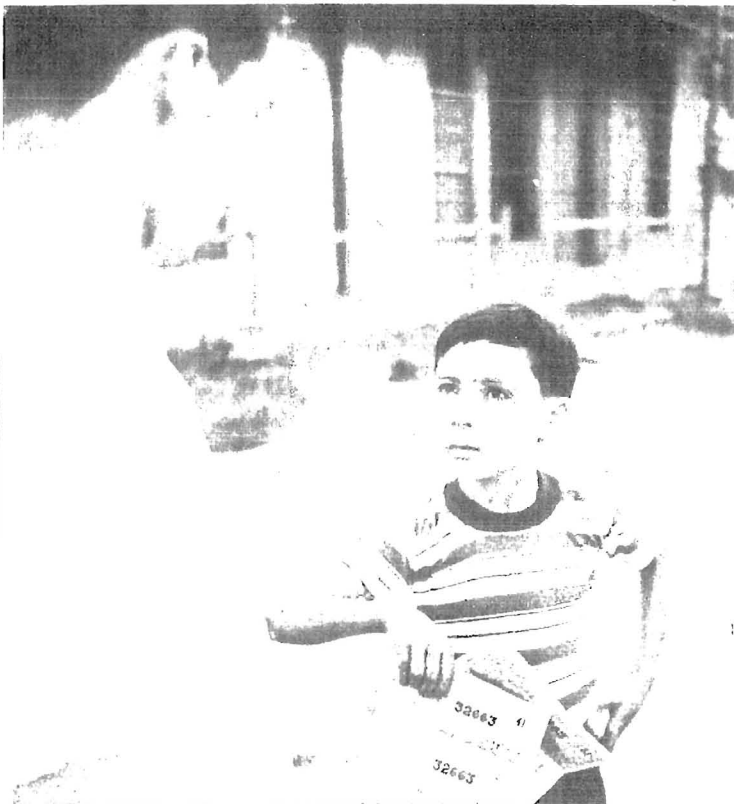
Una república en que no anden por las calles miles de muchachos de edad escolar vendiendo billetes