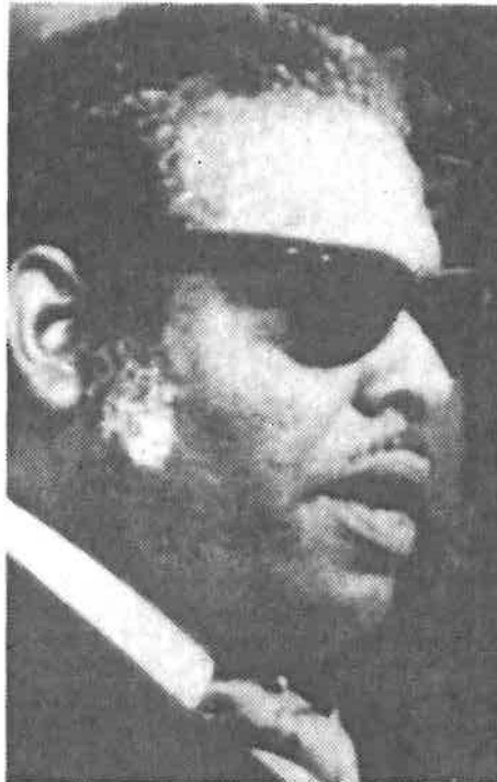
...el premier de Barbados, Errol Barrow, se lavó las manos al declarar que el avión cayó fuera de sus aguas jurisdiccionales...

Recientemente una fuente vinculada con sectores costarricenses y