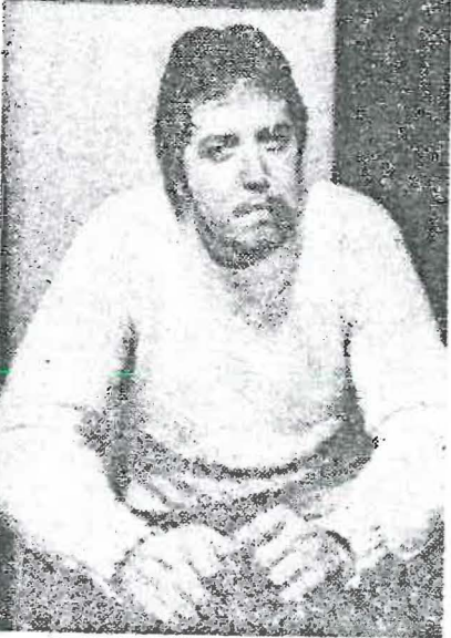
Anti-Castro leader Armando Santana in 1979.

South Florida. There is no allegation they actively engaged in narcotics themselves."