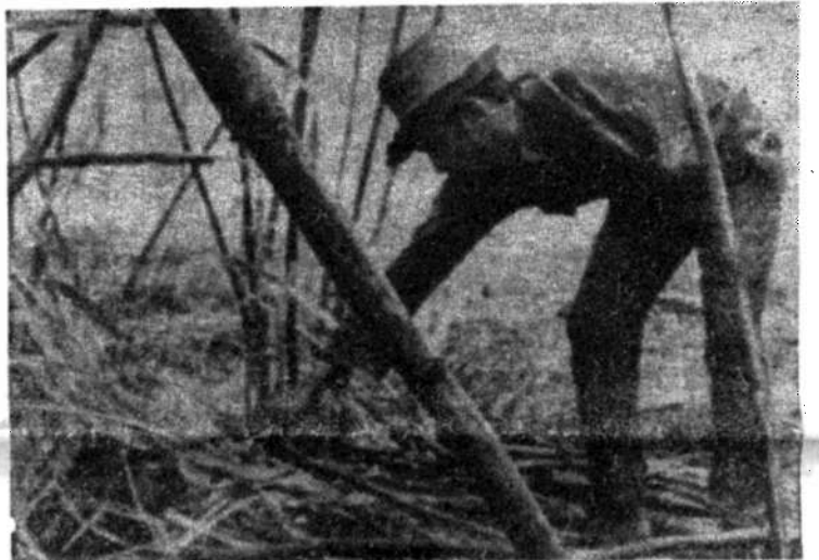
El Gobierno Cubano reconoció oficialmente su ineptitud para sacar a Cuba del subdesarrollo y además, que los obreros no apoyan el régimen.