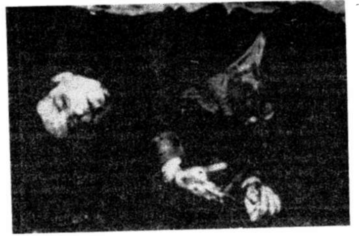
El cuerpo abaleado del líder revolucionario José Antonio Echevarría, quien dirigiera la acción contra el Palacio Presidencial, durante la lucha contra Batista.

francotirador apostado a la entrada de la habitación donde se encontraba el general Batista salvaron a éste la vida. De los héroes al asalto al Palacio Presidencial de Cuba apenas algunos sobrevivieron; los demás murieron o en el combate