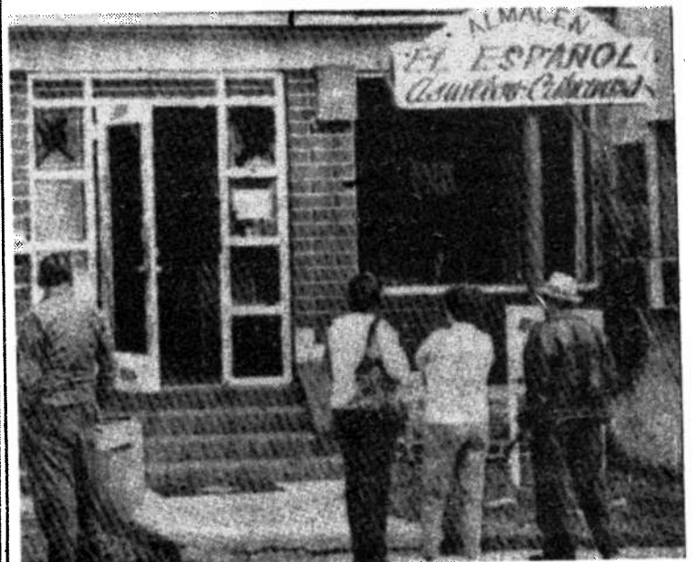
Ciertamente la violencia terrorista en suelo norteamericano constituye hoy día una estrategia de lucha obsoleta y errada, pues los esfuerzos hay que encaminarlos hacia dentro de Cuba.