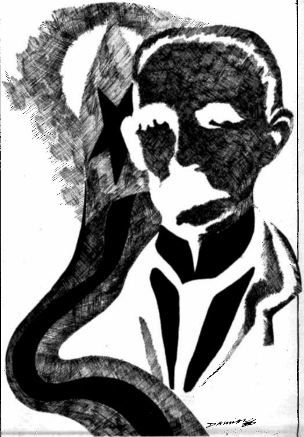
Ilustración: Damián Tellería

Creía en CUBA por lo mucho que los cubanos descreían en ella; creía en los cubanos por lo que estos descreían de sí mismos. El veía el destino de un pueblo que Dios había permitido que existiera porque tendría que decir y obrar, decidir y ordenar, para sí y para la humanidad entera.