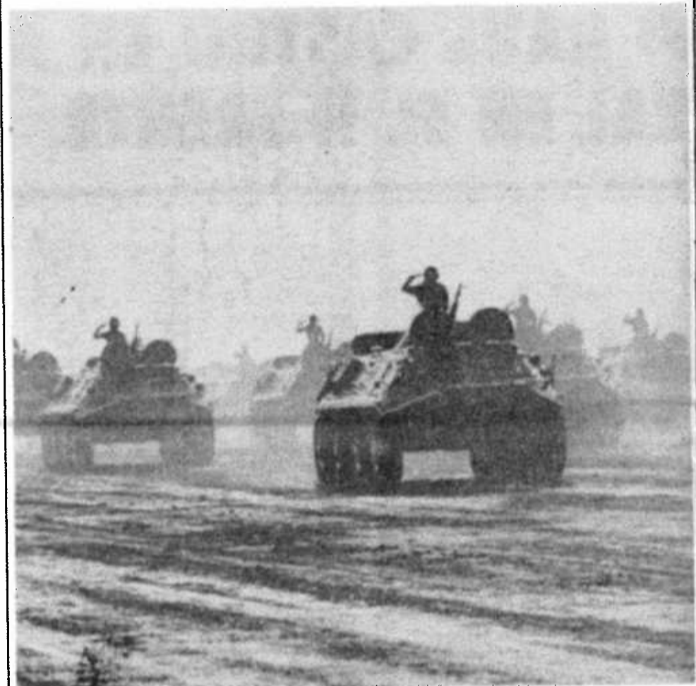
El Gobierno de Cuba exporta el terrorismo, como en El Salvador, y promueve la intervención directa como en Angola y Nicaragua, constituyendo una amenaza para la paz y estabilidad de éstos y otros pueblos y viola los puntos principales del Pacto Kennedy-Kruschev.