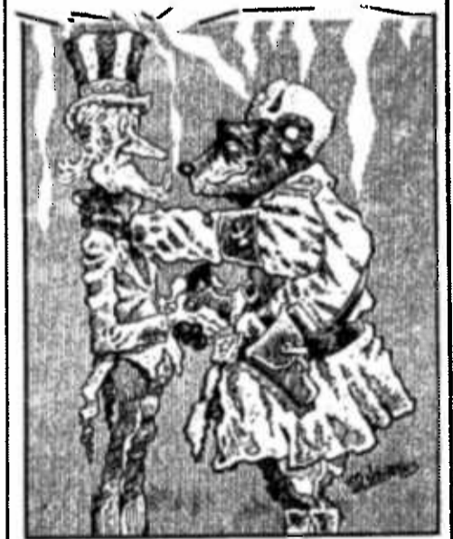
Ilustración: David Medina