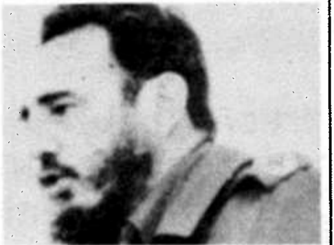
La imagen de Castro, que sigue invariablemente de verde olivo, con botas guerrilleras, gorra protectora y una barba, que aunque empieza a ser canosa, no deja de ser una perenne apología al desbarajuste.

...Y un ganchito; dice una expresión popular. Lo cierto es que ya -para muchos demasiado tiempo- Castro bajó de sus agueridas montañas lejanas. Con 33 años, que la prensa de entonces se apresuró a confrontar con la edad de Cristo. Joven y alto. Quizás más de lo grandote que ahora está. Eso sí; siempre de verde olivo, siempre con barba y botas militares, que los zapatos no están hechos para pies guerrilleros, ni tampoco la Gillette para rostros revolucionarios. Afónico y nervioso. Gesticulante.