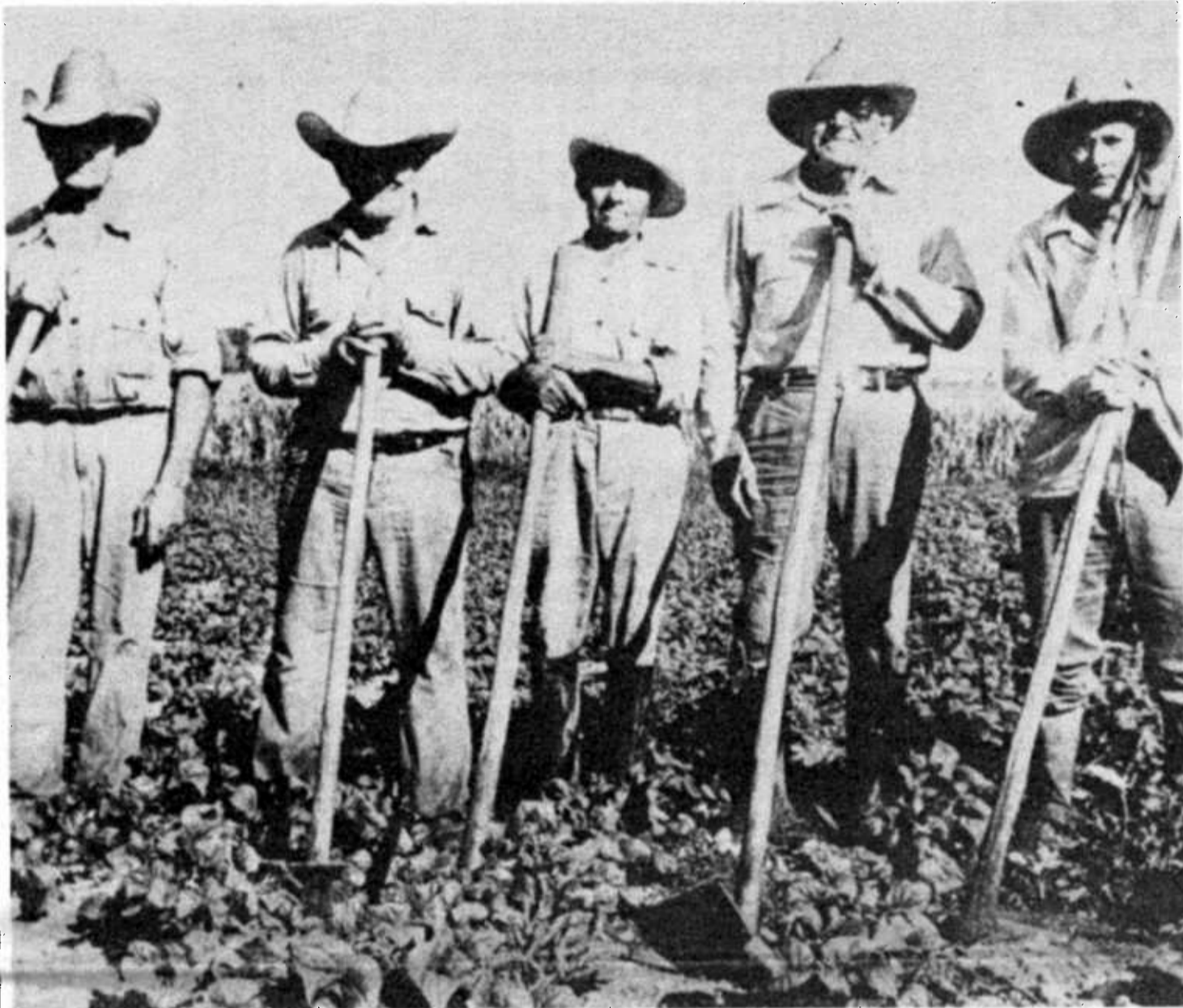
A pesar de 27 años de totalitarismo comunista, el gobierno de Fidel Castro ha sido incapaz de industrializar al país y tecnificar la agricultura, persistiendo en los métodos de producción anacrónicos y rudimentarios.