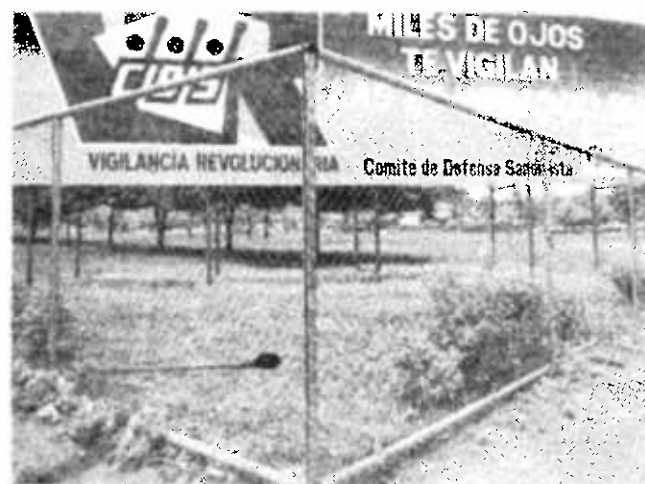
Valle sandinista en Managua

Es oportuno citar aquí las palabras de Eloy Gutiérrez Menoyo que el 21 de octubre de 1978 declaró desde una prisión de Cuba comunista: "NO CREO QUE HAYA ALGUIEN OPUESTO A ESTA LIBERACION DE PRESOS... NADIE PUEDE Oponerse a eso después de los años que hemos pasado aquí y lo que hemos sufrido... TODO LO QUE SE NECESITA ES UNA NOTIFICACION DEL GOBIERNO". Y para concluir agregó "HAY UNA TERCERA CUESTION QUE SI REQUIERE UN DIALOGO: EL PROBLEMA DE LA LIBERACION DE CUBA... LIBERTAD DE PRENSA... LO DIGO PORQUE CONSIDERO QUE UN DIALOGO SERIA UTIL, PERO ACERCA DE COSAS MAS FUNDAMENTALES". Lo más fundamental para nosotros los cubanos sin condiciones es la libertad total de nuestra patria.