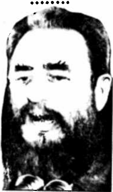
Fidel Castro, el Tirano

Para la historia debe quedar el hecho de que el régimen marxista-leninista de Cuba cuenta con el "privilegio" de tener los presos políticos más antiguos del mundo.