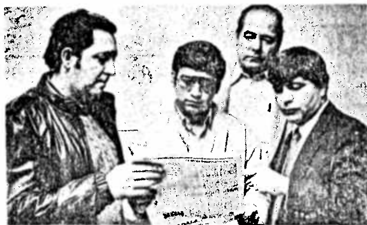
El Comité Solidaridad por una Centroamérica Democrática (C.S.C.D.), una organización, creada para promover estados de opinión pública en apoyo a los pueblos de Centroamérica.