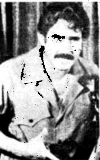
Edén Pastora, del Frente Revolucionario Sandino

David Morales Bello, diputado del Partido Acción Democrática, dijo que el narcotráfico tiene "el visto bueno" del gobierno castrista y está estrechamente ligado al movimiento subversivo. Estas palabras fueron expresadas por Morales Bello en conferencia de prensa el día 20 de junio en Maracaibo.