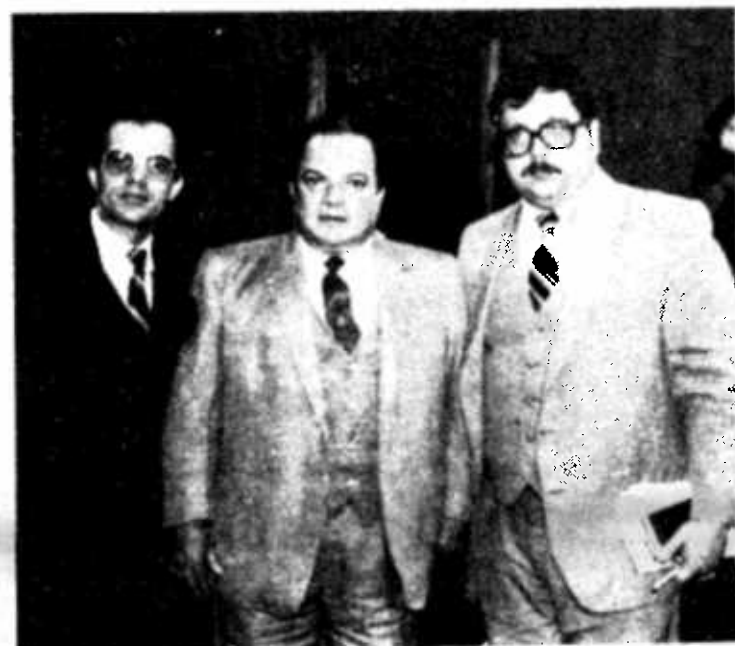
REUNIÓN EN COSTA RICA.