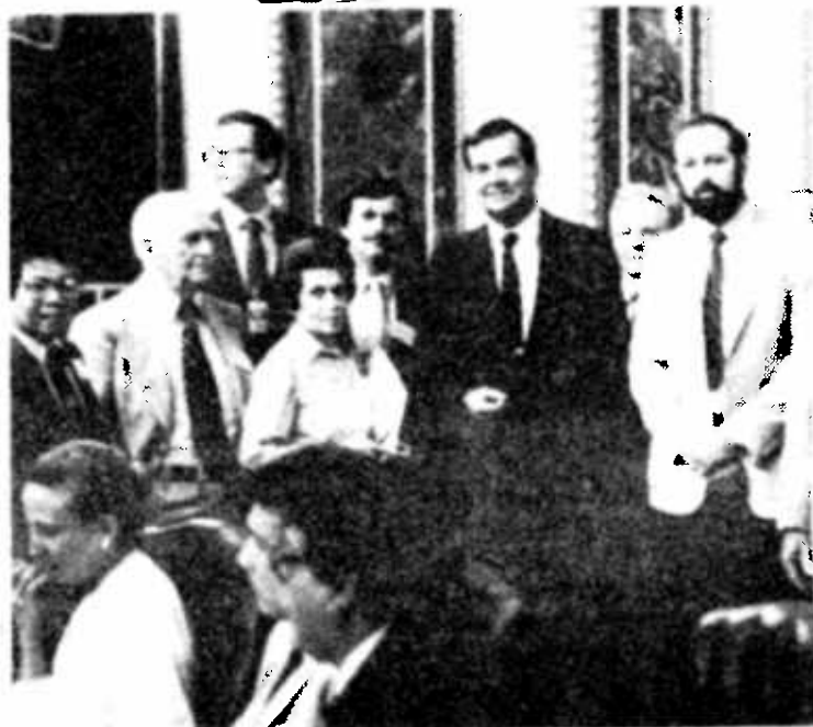
William Clark, del Consejo Nacional de Seguridad de Estados Unidos, con Gustavo Marín Duarte y otros invitados en la Casa Blanca.

Terminamos con optimismo, con fe en los destinos de nuestra patria, seguros del nivel de conciencia de nuestros miembros y conscientes del compromiso que nuestra meta de independencia total de Cuba sea alcanzada.