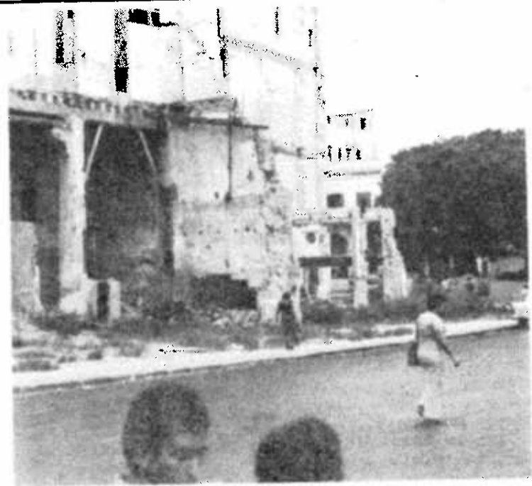
En la foto vemos una de las muchas casas en La Habana que están derrumbadas o apuntaladas, prueba de la incapacidad del Estado de resolver hasta los problemas más elementales del país.

Como cubanos que somos tenemos que vernos dentro del contexto de una política mundial que