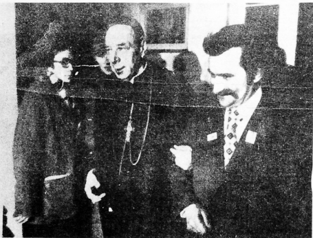
El Cardenal Stefan Wyszynski, guía espiritual de los trabajadores polacos, conversa alegremente con el populista líder sindicalista, Lech Wallesa, después que la Corte Suprema de Polonia dejó sin efecto la sentencia de una corte menor, que limitaba la independencia de la Federación de Sindicatos Libres.