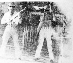
sato y apropiado cancelar toda ayuda militar a El Salvador.

SIRVIENDO , para adquirir en el sacrificio, el sentido verdadero de la vocación política.