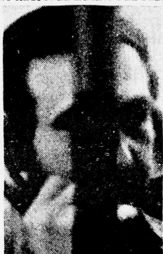
GUILLERMO NOVO SAMPOL