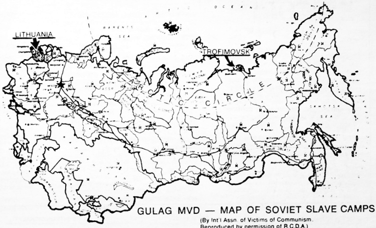
GULAG MVD — MAP OF SOVIET SLAVE CAMPS

(By Int'l Assn. of Victims of Communism Reproduced by permission of R.C.D.A.)