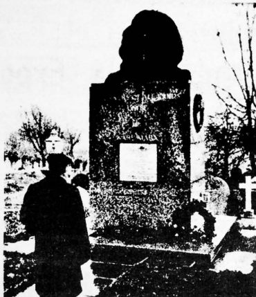
Mausoleo de Carlos Marx en Londres. Hasta ahí llegó la mano justiciera del Movimiento Nacionalista Cubano. Aquí se colocó una potente bomba de C-4, que fue descubierta minutos antes de explotar.