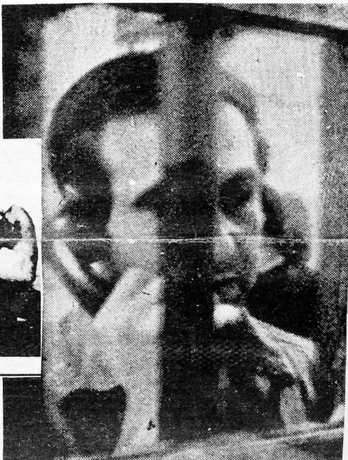
PRESO FEDERAL No. 80125

Trae tu Recaudación a los siguientes lugares: