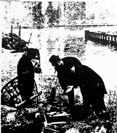
Lugar donde se colocó la bazuca para disparar contra la ONU, en los momentos en que hablaba el Che Guevara.

Ya están entonces puestas en crisis las dirigencias del exilio responsabilizadas con los sucesos de Girón, pero como aun quedan vigentes los estragos de aquel fracaso que ha llevado de desprestigio la política norteamericana ante todos los gobiernos del mundo, fortaleciendo el poder expansivo y conquistador