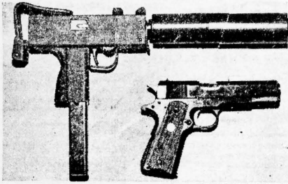
The type of submachine-gun purchased by Letelier, equipped with silencer and with 32-round clip in place. With stock folded as shown and silencer removed it is about the same size as Colt .45 automatic in picture.

una carta de Beatriz "Tati" Allende, hija de Salvador Allende, dirigida a Orlando Letelier, pieza clave de la conexión cubana en los Estados Unidos. Abajo: Orlando Letelier, ex embajador chileno en EE.UU., y agente de la subversión comunista.