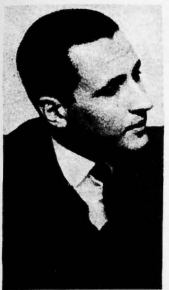
Grondona: 'La pura fuerza no perdura'

En Buenos Aires ha sido publicado el libro "La Argentina en el Tiempo y en el Mundo", de Mariano Grondona, abogado, sociólogo y periodista argentino de menos de cuarenta años de edad. Dicho libro ha despertado un desusado interés en el país, no sólo por su tema, sino también porque su autor es uno de los hombres más cercanos al presidente Juan Carlos Onganía y, según se admite, uno de los más sólidos ideólogos de la Revolución de 1966.