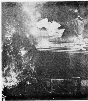
Disturbios Estudiantiles en Italia