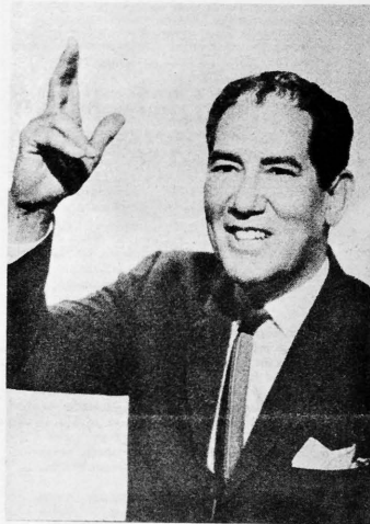
DR. ARNULFO ARIAS

¿Tendrá vocación de Kerensky centroamericano? ¿Se dejará rebasar por los rojos infiltrados en la coalición opositorista? O, por el contrario, encaminará a Panamá por el sendero de un sano nacionalismo?