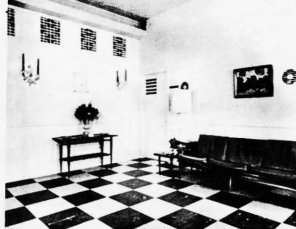
VESTIBULO QUE DA ENTRADA A LOS LOBBYS Y A LAS OFICINAS