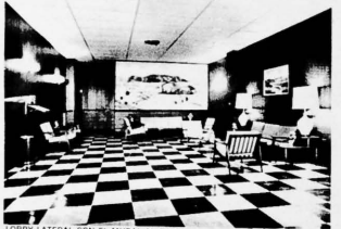
LOBBY LATERAL CON EL MURAL AL OLEO "VALLE DE VIRALES"

Caballero-- un nombre que constituye un símbolo, sostenido con un prestigio tradicional por más de un siglo.