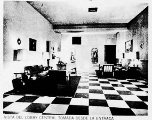
VISTA DEL LOBBY CENTRAL TOMADA DESDE LA ENTRADA