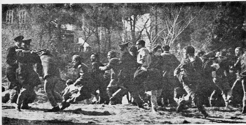
NACIONALISTAS VS. MARXISTAS