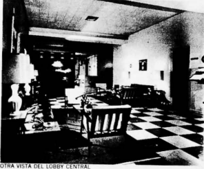
OTRA VISTA DEL LOBBY CENTRAL