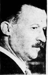
Onganía: difícil adivinar su propósito

tar y el control electoral de Buenos Aires. "Y también verdad -añade Grondona- incurridamente agudamente en la actualidad - que un jefe militar que ocupa el poder político no completa su trayectoria sin poseer el poder electoral dentro de un esquema republicano y constitucional. Esto es el dilema de la Revolución de 1966... La pura fuerza no consigue instalarse ni, por lo tanto, perdurar".