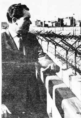
Richard Nixon contempla el infame Muro de Berlín en 1963.