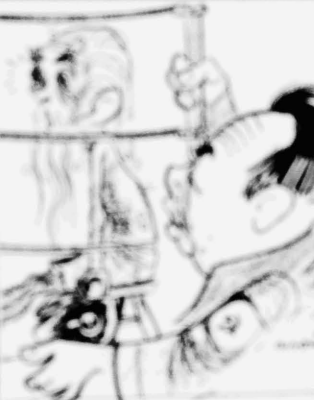
Figura principal de la obra...