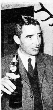
El fotógrafo Heinz Sutterlin