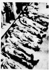
victimas de los guerrilleros colombianos