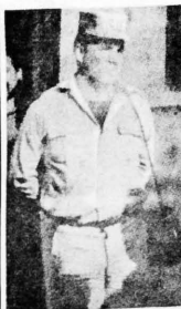
el Mayor Mario Vargas Sotillo dirigió la primera victoria de los rangers bolivianos contra los invasores castrocomunistas.