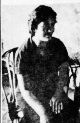
... estos fotografías corresponden a familiares de soldados bolivianos, víctimas de los emboscados ordenes de los guerrilleros castrocomunistas que invadieron el territorio de Bolivia...