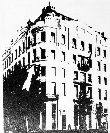
La flecha señala la habitación de la Embajada de E.E. UU. que ocupa el Cardenal Mindszenty desde hace once años.

Quiera Dios que cuando llegue ese día, nosotros, los iberoamericanos, podamos estar erguidos junto a ellos en número de millones, para la Gran Cruzada. ¡Gloria a los héroes y mártires de Hungría! Su ejemplo es acicate constante para nosotros.