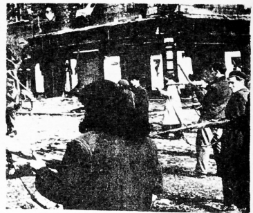
Jóvenes de ambos sexos, empuñando las armas Male and female youngsters grabbing weapons.