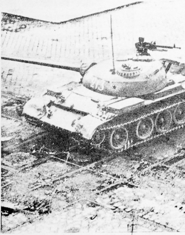
Se impone la fuerza bruta