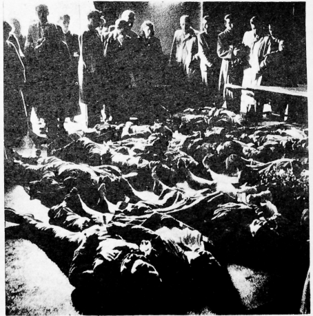
Victimas de la barbarie soviética