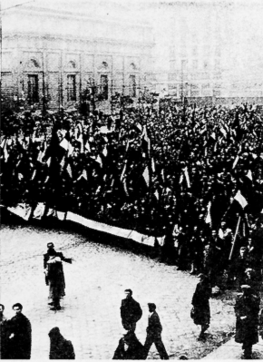
La Revolución húngara fue realmente popular The Hungarian Revolution was really popular.