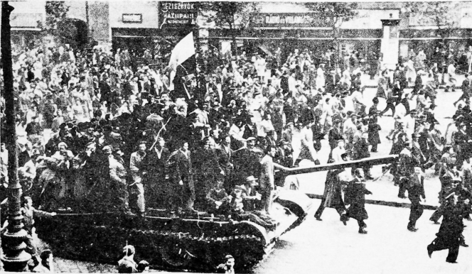
Triunfa la Revolución Nacional