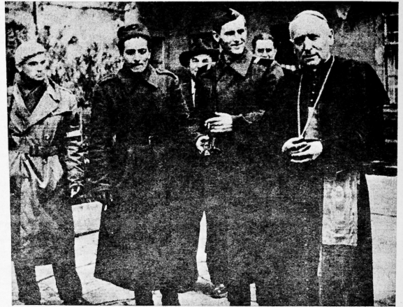
Los patriotas liberan al Cardenal Mindszenty