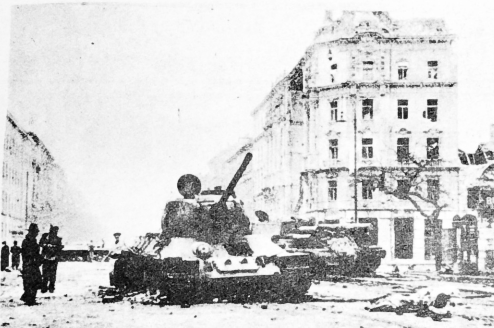
Los patriotas luchan desesperadamente