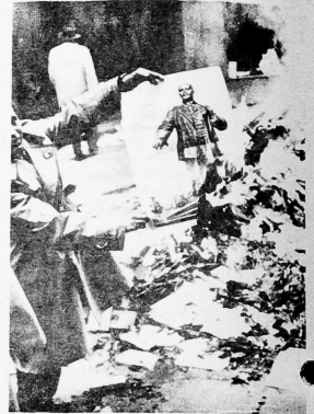
Quemando los símbolos de la opresión Burning symbols of oppression.