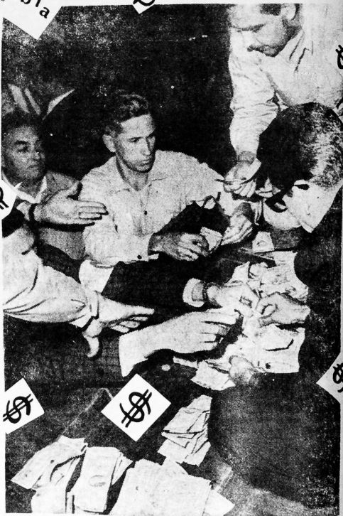
Una mala novelita de gansterismo político.

HECHOS A MANO POR TABAQUEROS CUBANOS Y CON TABACO COSECHADO POR EXPERTOS CUBANOS