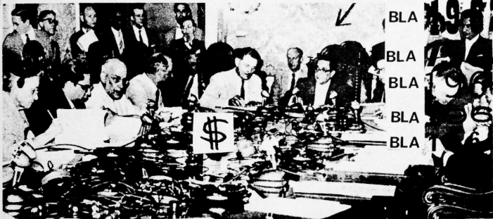
"No hay lenguaje ni circunloquio diplomáticos capaces de desmentir el argumento aplastante de los hechos . . ."