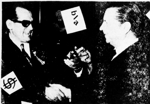
Los narcisistas del destierro han agotado la paciencia de los exilados publicando millares de fotografías que muestran que son "amigos de los diplomáticos de América". Los personajes cambian pero el fondo de la escena es el mismo. Son tomadas en los gabinetes de los Embajadores. Y el fondo "moral" es idéntico. Se publican para engañar a los pobres que todavía creen en los "respaldos de Cancillerías". La otra foto a la derecha, se explica por sí sola. El momento en que se contaba la plata, después de pasar el cepillo.