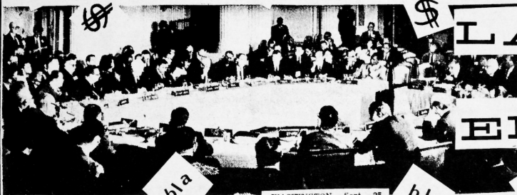
—A Bolivia y Venezuela, que formularon cargos de subversión contra Cuba, la O. E.A. les hizo saber que está "solidamente" detrás de ellas respaldándolas.

WASHINGTON, Sept. 25 (UPI) — El Secretario de Estado Dean Rusk dijo anoche que la Organización de los Estados Americanos (O. E.A.) "más unida que nunca" había "enviado un mensaje al primer ministro comunista Fidel Castro" de que ponga fin, más vale temprano que tarde, a la intervención y la agresión en el Hemisferio.