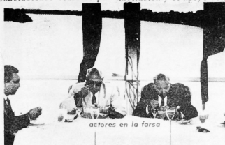
actores en la farsa

El Montreal Star que se edita en Canada, dice: "Un cohete 3.5 de 20 pulgadas de largo, adherida a un reloj y batería, fue encontrada por casualidad en un lugar cercano al Pabellon de Africa, en