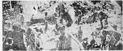
Recogiendo los escombros del Hotel Rey David.

que respetarla. Los árabes. Los otonedores de la ONU tuvieron que respetarla. La "IRGUN", el "STERN" y la "HAGANA" eran, en su momento, la voluntad desesperada de sobrevivir, los