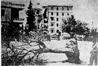
Bombardeo de las Oficinas Generales del Gobierno del Mandato inglés, en el Hotel Rey David, en Jerusalem, el 22 de Julio de 1946.

EL HEROICO Y DES- ESPERADO PUEBLO JUDIO NO MENDIGO, NO SE ARRASTRO, NO ENTREGO DOCUMENTOS RIDICULOS, NI ORGANIZO MARCHAS ABSDURAS, SINO QUE UTILIZO EL ESTRUENDO DE LA DINAMITA PARA EXIGIR SU DERECHO A SER LIBRE E INDEPENDIENTE. ASI NACIO EL ESTADO DE ISRAEL.