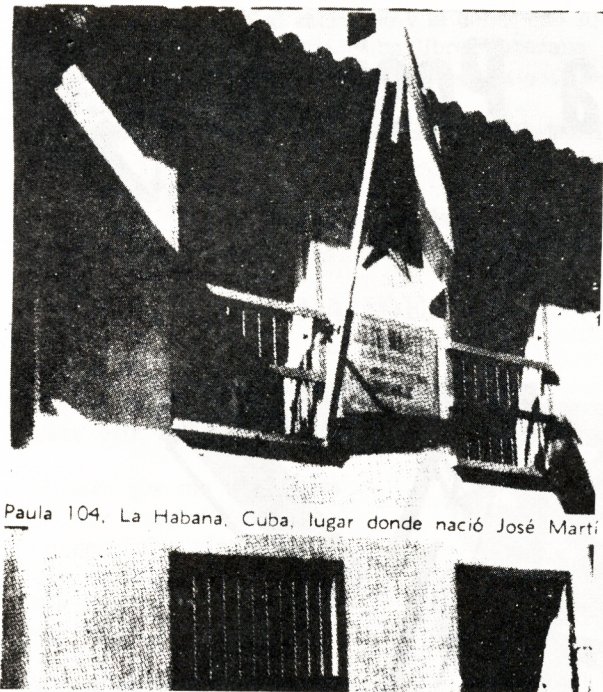
Paula 104, La Habana, Cuba, lugar donde nació José Martí