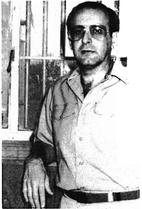
El pueblo cubano tiene derecho a luchar por su libertad.

de las ideas anarquistas de Prudhon y efectuadas más tarde también por los nihilistas rusos. Entonces nosotros no somos ni nihilistas ni anarquistas. Nosotros peleamos contra el enemigo de nuestra civilización y en defensa de los valores humanos y espirituales. Quienes clasifiquen a los héroes y mártires de la patria como terroristas o son unos ignorantes en política o lo hacen recibiendo órdenes de La Habana.