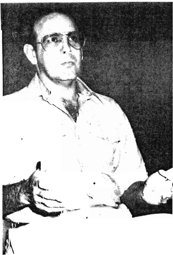
Se presentó en el juicio el senador McGovern para alabar a Letelier.

El terrorismo no es más que el uso sistemático del terror como medio de coacción. Nosotros jamás hemos llevado a cabo un hecho terrorista y no conozco a ninguna organización de patriotas cubanos que pueda ser clasificada como terrorista. Todos los hechos de acción de las organizaciones combatientes del exilio han sido efectuados contra individuos o puntos fijos determinados del Castro comunismo. Terrorismo es sembrar el terror. Es sembrar el terror indiscriminado dentro de las filas del pueblo. Terrorismo es poner una bomba en una guagua. Terrorismo es poner una bomba en un cine o en un café o en el Tropicana de La Habana. Esas fueron tácticas de otros, de los comunistas. Fueron tácticas utilizadas para sembrar el terror dentro del pueblo y así dañar la economía del país. Las tácticas comunistas fueron el resultado