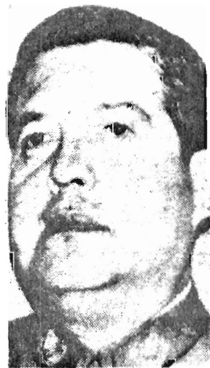
Juan Manuel Contreras

Posteriormente a la redacción de este artículo, el gobierno de Chile ordenó el arresto del ex director de la disuelta Dirección Nacional de Inteligencia (DINA) general retirado Juan Manuel Contreras y de otros dos oficiales chilenos, en cumplimiento de una solicitud del departamento de Estado de Estados Unidos. Los tres fueron acusados por un gran jurado federal en Washington de haber asesinado al exministro de Relaciones Exteriores de Chile, Orlando Letelier, hecho ocurrido en la capital norteamericana el 21 de septiembre de 1976. El ministerio del Interior chileno, al anunciar el arresto del general Contreras, señaló que la disposición se tomó en cumplimiento de las disposiciones del Tratado de Extradición suscrito por ambos países en 1902. Dijo igualmente