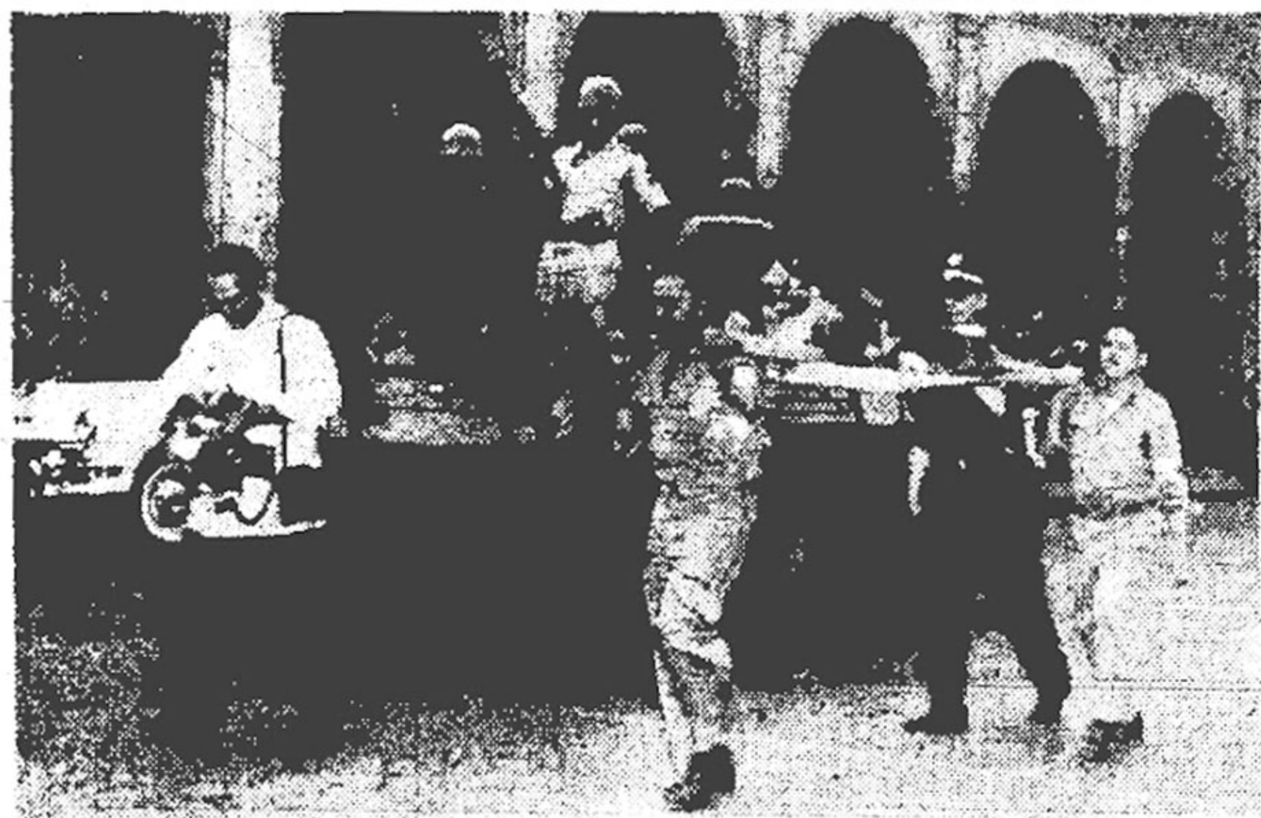
Los soldados de un tanque, apostado en la calle de Zulueta, ven pasar un herido en una camilla. Junto a ellos un repórter gráfico en plena acción.