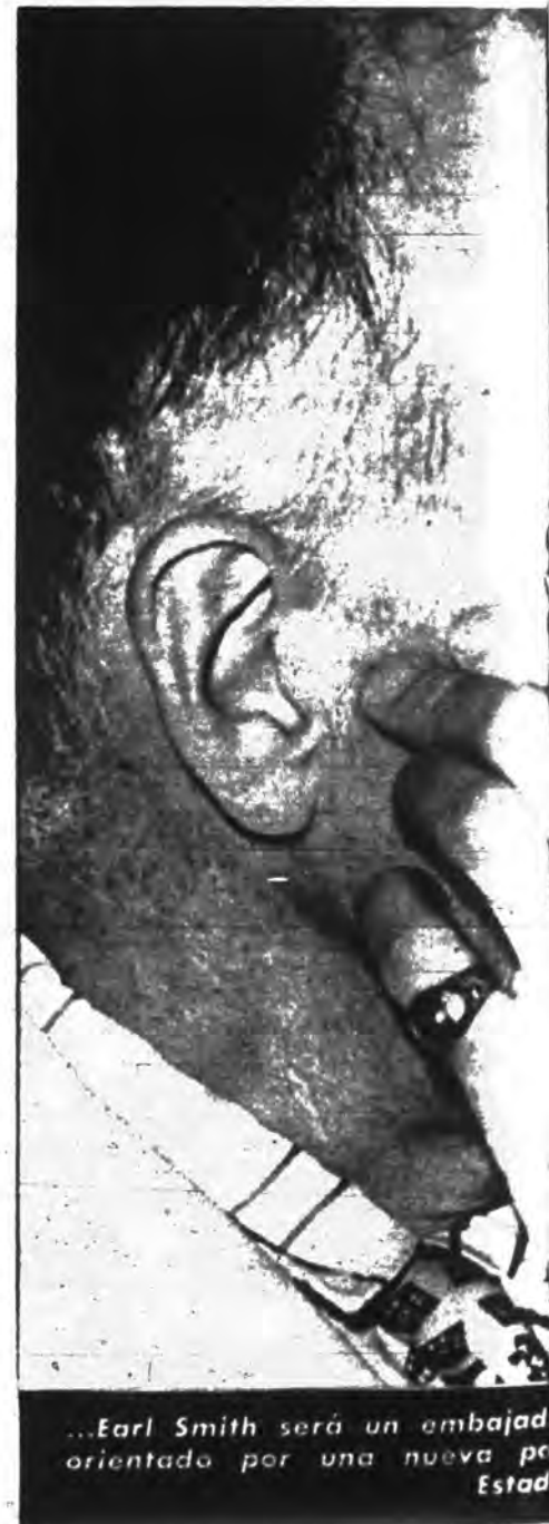
...Earl Smith será un embajador orientado por una nueva política del Estado

Vi a Matthews la víspera de su entrevista con el Presidente Fulgencio Batista. Escuchaba paciente al doctor Raúl Chibás y a sus ortodoxos históricos, hundido en una butaca incómoda en la modesta salita de la oficina de "The New York Times", a la vera de la cúpula palaciega. Esperaba momentáneamente, cuando oí a un hombre