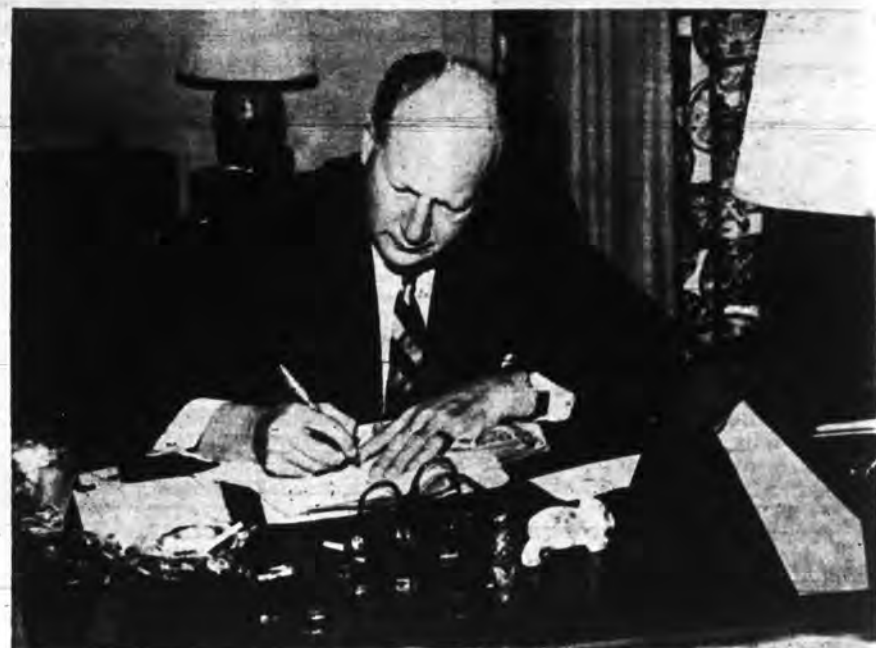
A petición del corresponsal de BOHEMIA, el Embajador Smith redacta el cordial mensaje de salutación al pueblo de Cuba que reproducimos en nuestras páginas.

—Mucho. De ahí que la haya visitado con la frecuencia que mis ocupaciones me han permitido. Y que la recuerde con simpatía en nuestras reuniones en West Palm Beach, donde residí permanentemente.