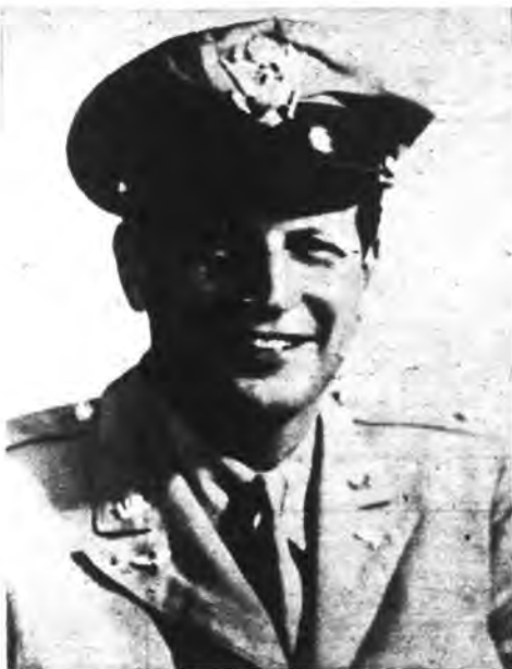
Durante la II Guerra Mundial, el nuevo Embajador norteamericano en Cuba sirvió cuatro años en el Ejército y su Fuerza Aérea. Helo aquí con el uniforme de la FA donde llegó a alcanzar la jerarquía de teniente coronel, destacándose por sus servicios técnicos.