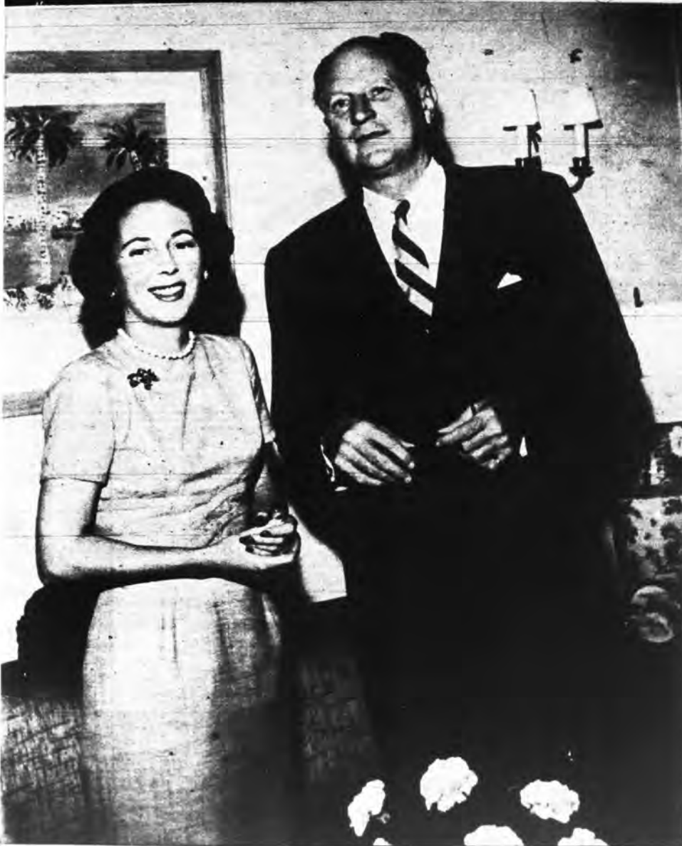
Earl Smith es el embajador de más estatura en el Cuerpo Diplomático norteamericano en la actualidad. Mide 6 pies 5 pulgadas y media. Señora, también, el más alto de los embajadores estadounidenses que hayan actuado en Cuba. Junto a él, la Embajadora se ve menudita y sonriente, mientras posan para BOHEMIA.