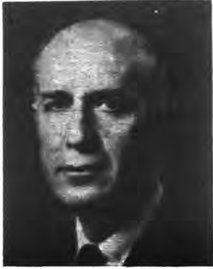
MATTHEWS.— "...injerta en su trabajo comentarios procaces e insultantes..."