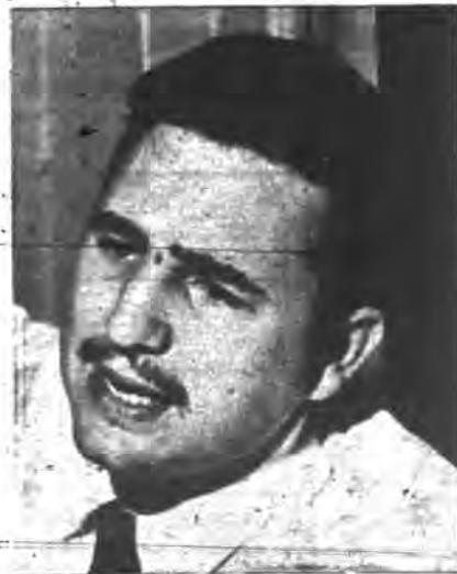
FIDEL.— "...en su programa se encuentran las inconfundibles directrices soviéticas..."

LA ACTUACION DE FIDEL CASTRO Y LOS SINIESTROS PLANES DEL MAYOR SERGEI YUWOROW PARA LA DOMINACION COMUNISTA DE LA AMERICA LATINA