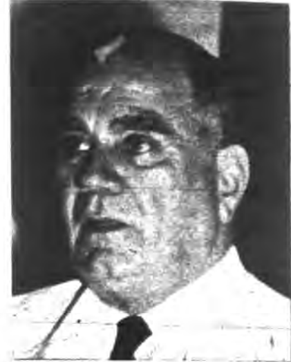
VERDEJA.— "...mis declaraciones, sujetas a la verdad más estricta..."

LA ACTUACION DE FIDEL CASTRO Y LOS SINIESTROS PLANES DEL MAYOR SERGEI YUWOROW PARA LA DOMINACION COMUNISTA DE LA AMERICA LATINA