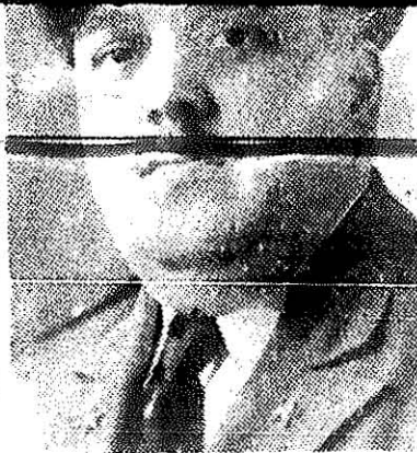
General Rafael Salas Cañizares