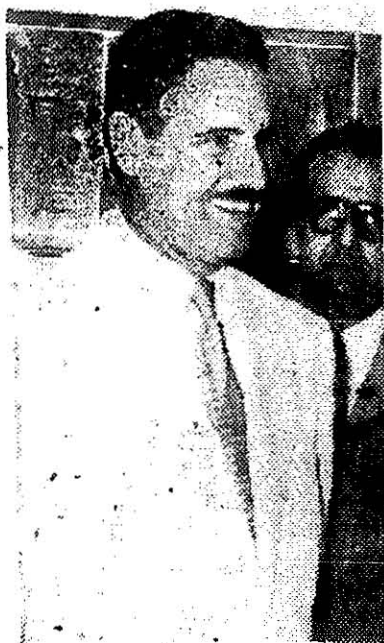
Dr. Carlos Prío Socarrás