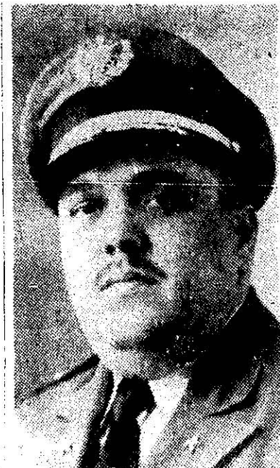
General Rafael Salas Cañizares

casos sufridos en sus planes, al ocupársele armas y descubrirse complotados. Prio no cesa en su empeño y aprovecha la oportunidad que él cree propicia, sabiendo molesto al dictador Trujillo por la campaña que nuestra prensa le hacía así como la seguridad de que nuestro Gobierno brindaba a los exilados políticos dominicanos, que en su condición de tales disfrutaban de la hospitalidad que se les brinda, creyó oportuno reafir-