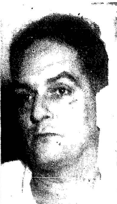
Dr. Aureliano Sánchez Arango