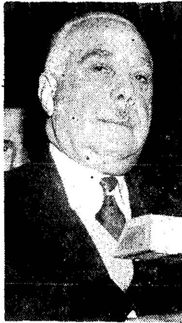
Rafael Leónidas Trujillo