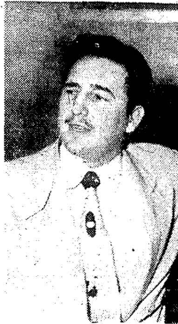
Dr. Fidel Castro Rus