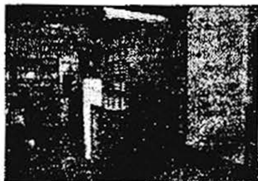
Interior de la Farmacia