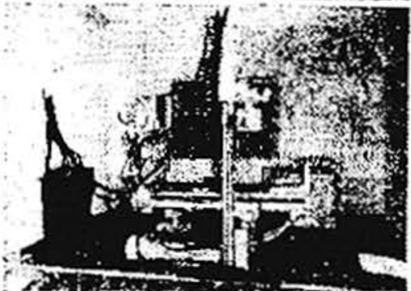
Departamento de Rayos X