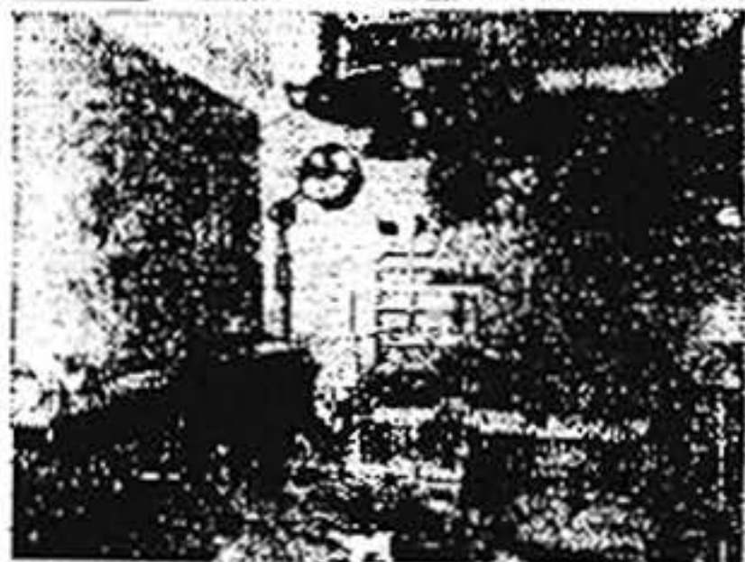
Uno de los salones de cirugía mayor